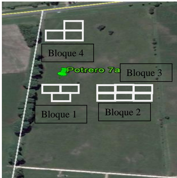
Figura 3. Ubicación espacial de las parcelas experimentales.

Cuadro 1. Manejo de la altura remanente en los tratamientos (TC, TM y TL) a lo largo del experimento.